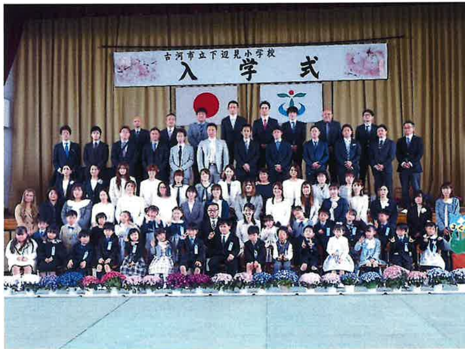
令和5年度 入学式の様子