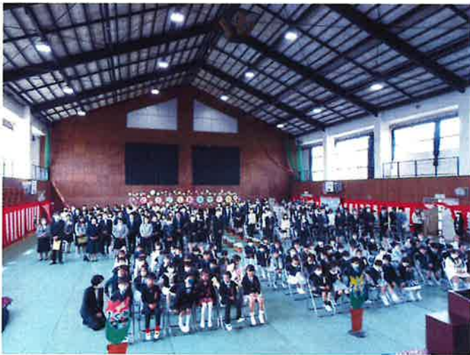
令和5年度 入学式の様子